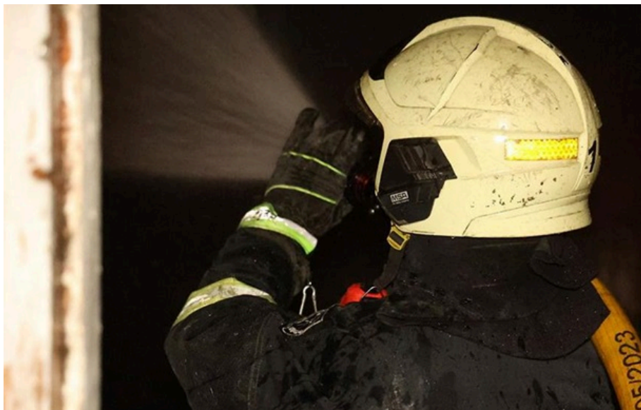
Фото: ДСНС Дніпропетровщини (ілюстративне фото) Інформація про постраждалих уточнюється, повідомила місцева влада