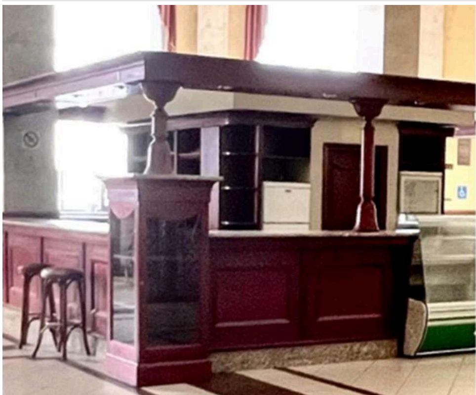
«Згорнули лавочку» через хабарі: Корупційний скандал на вокзалі у Львові залишив пасажирів без кави та буфетів

Зайшов у Львові на вокзал випити кави в залі очікування. А там херак-колхоз-маяк в тому сенсі, що голяк - буфет зачинений. Охоронець каже, що приблизно пару тижнів як просто мовчки згорнули лавочку без пояснень. То я поліз гуглити і ось що знайшов - якраз пару тижнів тому місцеве управління стратегічних розслідувань Нацполуп оголосило підозри місцевим корупціонерам.