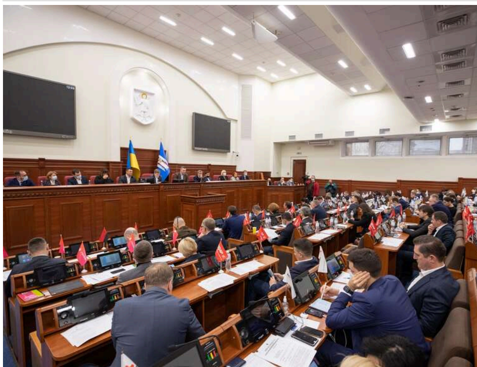
"Побутова сварка" замість теракту: депутати Київради вимагають звіту керівництва поліції

Кілька депутатів Київської міської ради підписали звернення з вимогою викликати на сесію 23 квітня 2026 року керівників Головного управління Нацполіції в Києві та Патрульної поліції столиці. Вони наголошували, що це питання має стати пріоритетом на сесії – особливо з огляду на численні "білі плями" в історії з голосіївським стрільцем. Зокрема, це стосується реакції керівництва Нацполіції та Голосіївського районного управління після отримання повідомлень про постріли на вулиці: патрульні, які прибули на виклик, вважали, що йдеться про звичайну побутову сварку.