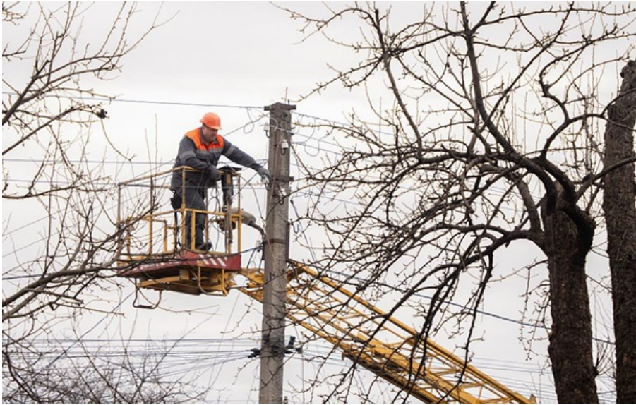
Ситуація в енергосистемі може змінитись, зазначили в компанії