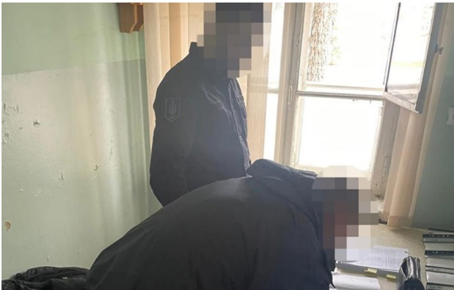
ДБР викрило шахрайство експравоохоронця щодо військового з Кременчука

Зловмисник спільно з кумою обіцяли допомогти з оформленням документів на лікування військового, втім, після отримання 15 тисяч доларів перестали виходити на зв'язок.