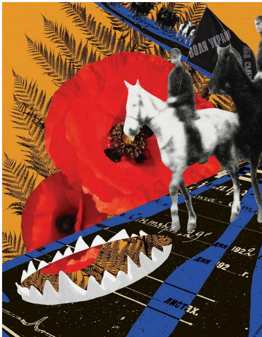
Повстанці Холодного Яру