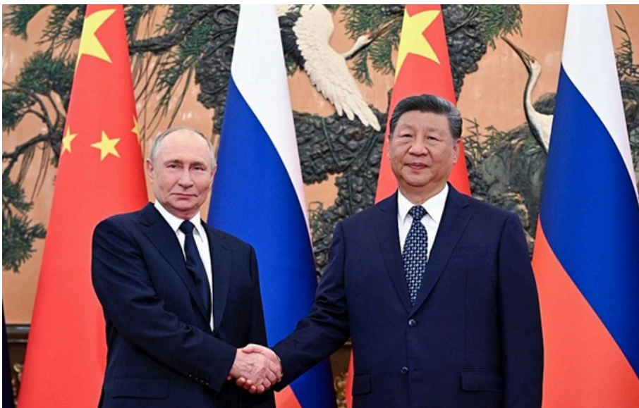
Володимир Путін і Сі Цзіньпін під час зустрічі у вересні 2025 року