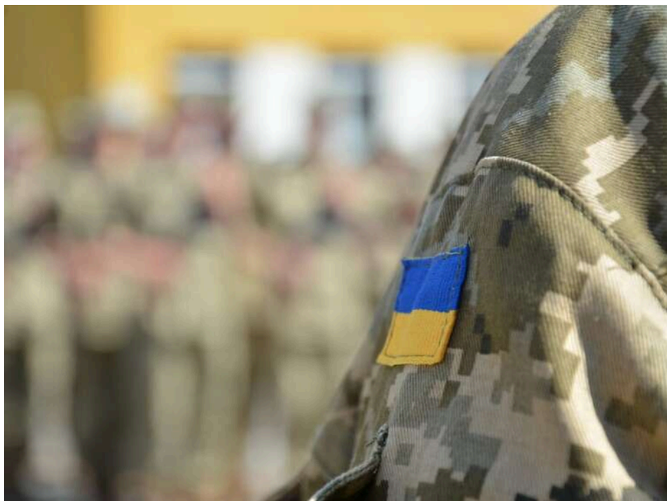
Примус — справа поліції: в Офісі військового омбудсмана виступили проти силової мобілізації силами ТЦК

У Офісі військового омбудсмана зазначили, що військовослужбовці територіальних центрів комплектування та соціальної підтримки не мають займатися примусовою мобілізацією.