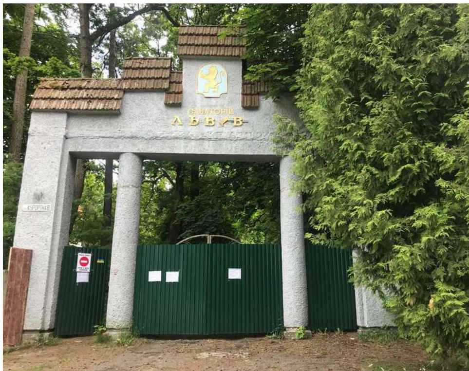
Крах «профспілкової» справи у Брюховичах: Суд зняв арешт земель санаторію «Львів» і припинив управління АРМА

У справі щодо корупції у Федерації профспілок України суд повністю скасував арешт земельних ділянок колишнього санаторію «Львів» в Брюховичах, що належать ТОВ «Рівера Сіті» та фізичній особі, і припинив управління ними через АРМА. Це дозволяє компанії продовжувати будівництво апарт-готелю.