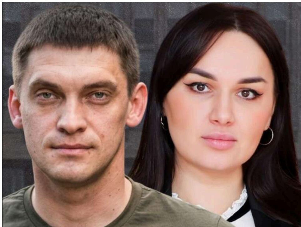
Сімейний підряд у білих халатах: як Іван Федоров через родичів освоєв мільйони на КТ-діагностиці у Запоріжжі

Іван Федоров керує Запоріжжям вручну, що особливо помітно на прикладі медичних закупівель. У той час як область перебуває в умовах війни та дефіциту ресурсів, через КНП «ЗОКЛ» роками реалізується одна й та сама схема з контрольованими тендерами. Формально процедури відповідають законодавству, але їхня суть зводиться до одного – спрямовувати бюджетні кошти до заздалегідь визначеного кола підрядників. Внаслідок цього лікарня перетворюється не на медичний заклад, а на транзитний пункт для перерозподілу грошей.