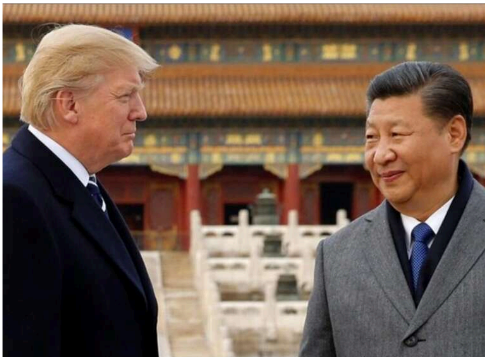
Трамп залишив Пекін із обмеженими результатами, тоді як Сі Цзіньпін зміцнив позиції, – Reuters