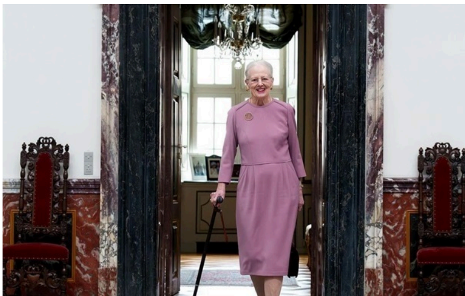
Королева Маргрете II

Королева Маргрете втомлена, але перебуває у доброму настрої. Медики продовжують оцінювати її стан і надають необхідну допомогу.