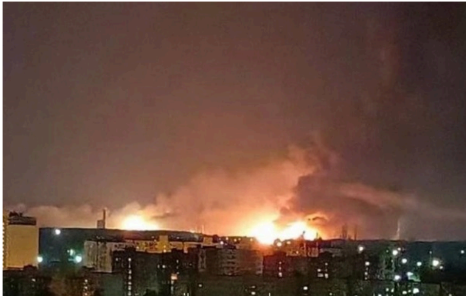
Пожежа у Рязані

Місцеві жителі чули потужні вибухи, а годом побачили у небі над містом велику вогняну заграву.