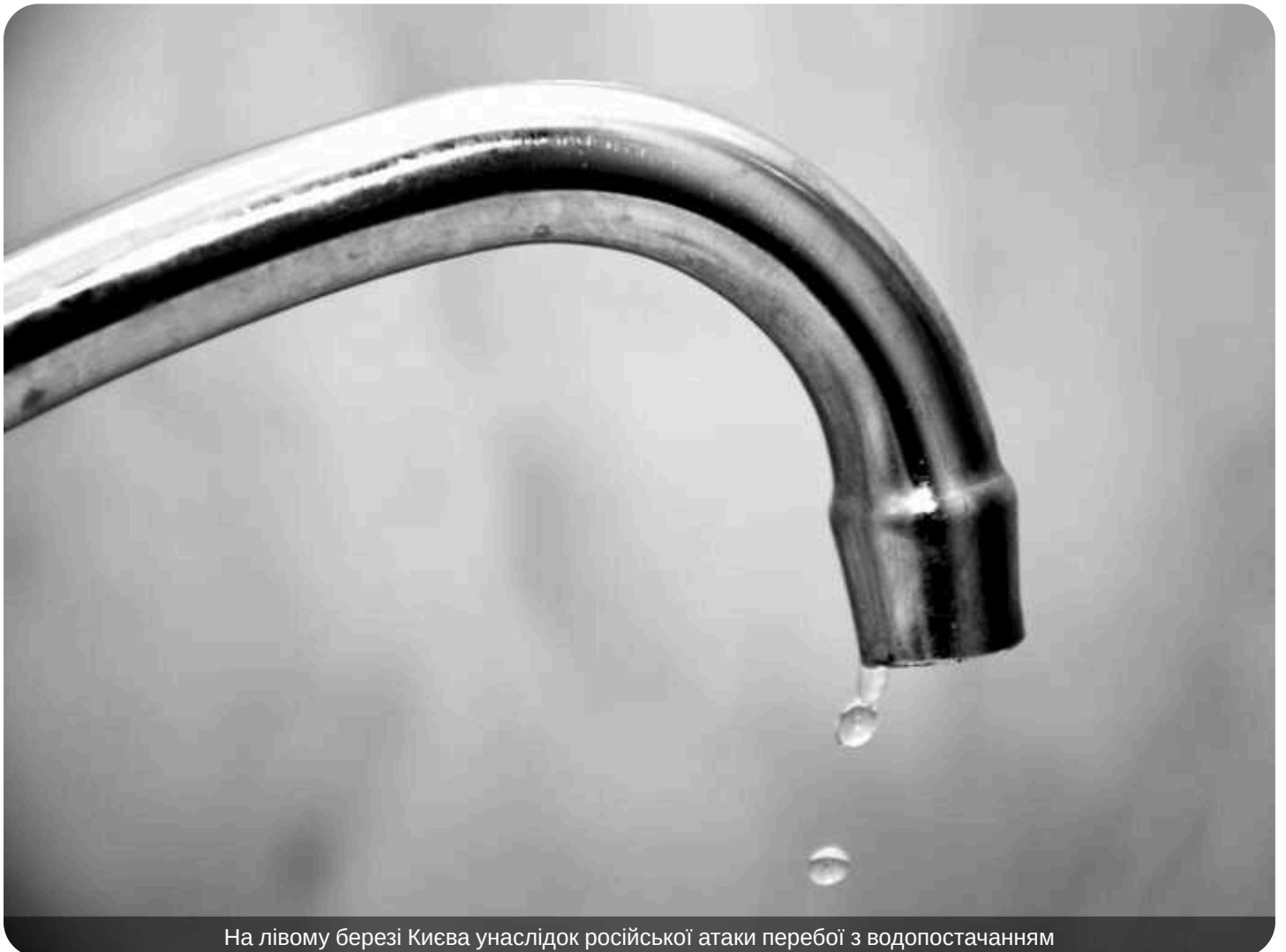
На лівому березі Києва унаслідок російської атаки перебої з водопостачанням

На лівому березі Києва внаслідок масованої російської атаки перебої із водопостачанням.