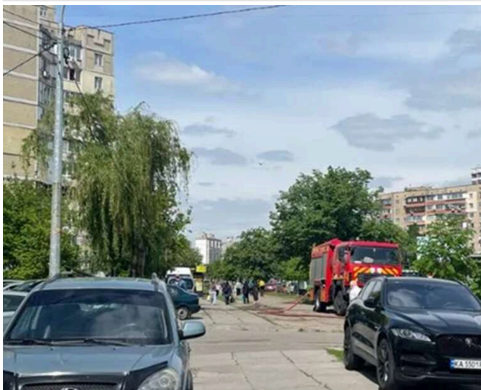
Атака РФ по Києву: Поруч зі зруйнованим будинком у юності мешкав мер Кличко та його брат

Ракетний удар, який зруйнував цілий під'їзд багатоповерхівки, стався на вулиці, де виріс Віталій Кличко. Саме на вул. Братства Тарасівців у Дарницькому районі Києва жили в дитинстві та юності брати-боксери Клички: існує відома світлина, де вони стоять перед будинком №8 на тодішній вул. Декабристів. Водночас місцеві жителі впевнені, що якість будівництва багатоповерхівок тут жахлива – зводили їх у часи тотального дефіциту та розпаду СРСР. Один удар – і інші під'їзди посиплються, як картковий будиночок.