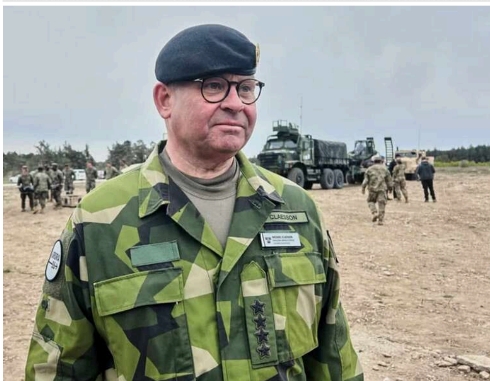
Перевірка НАТО на міцність: Швеція попереджає про ризик захоплення Росією островів у Балтійському морі

Швеція застерегла Данію від ризику, що Росія може окупувати один із островів у Балтійському морі, щоб перевірити відгук НАТО.