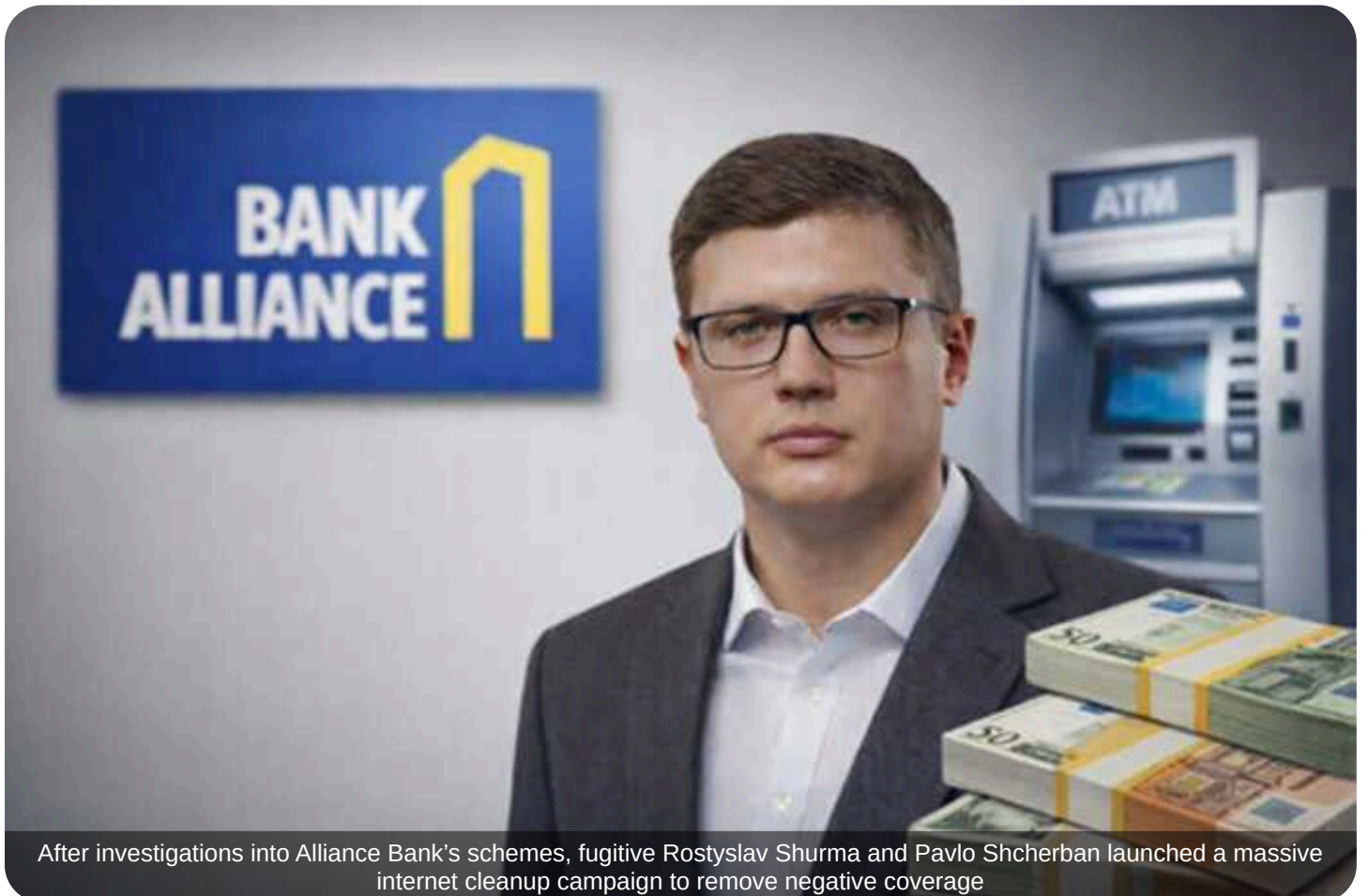
After investigations into Alliance Bank's schemes, fugitive Rostyslav Shurma and Pavlo Shcherban launched a massive internet cleanup campaign to remove negative coverage