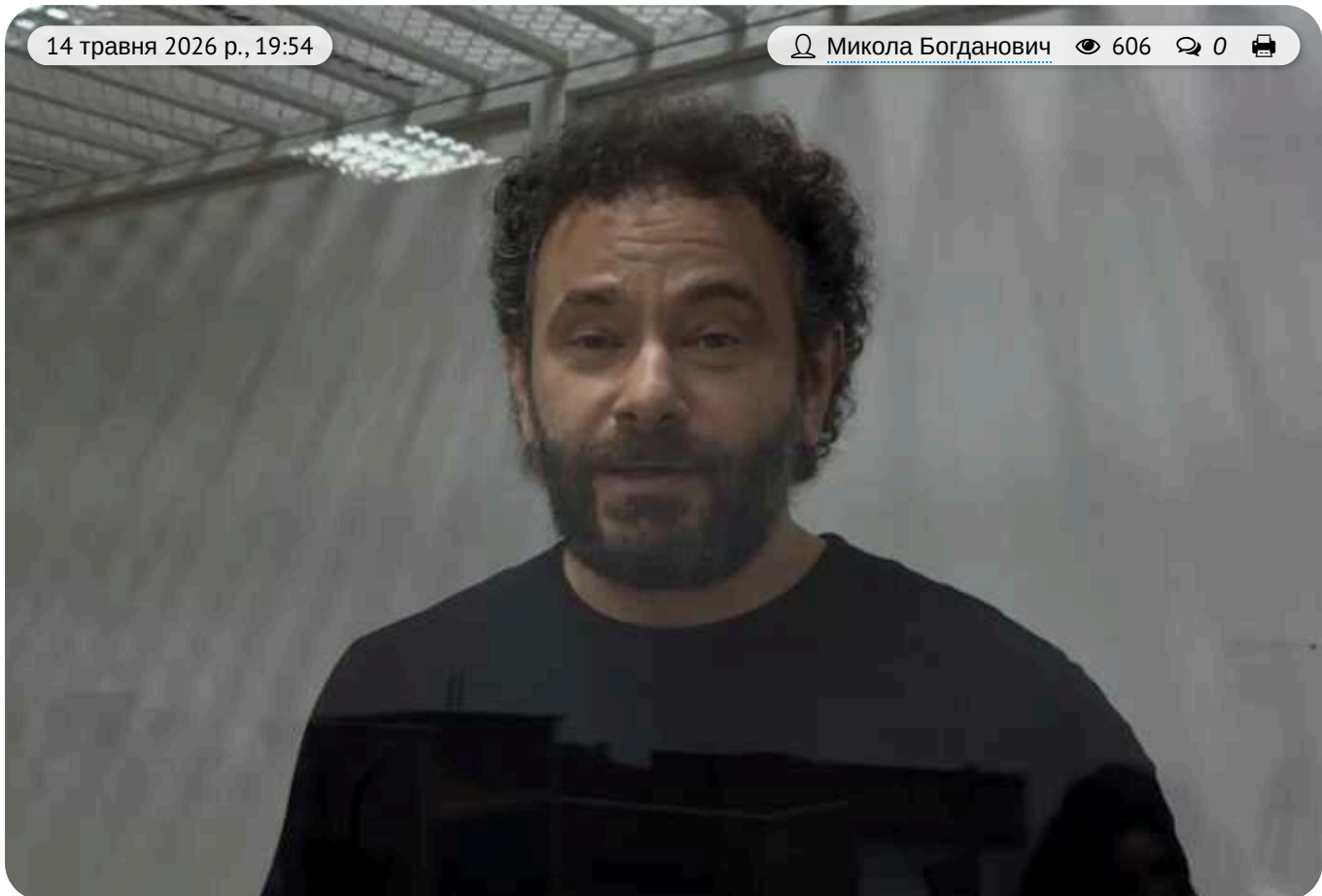
Суд взяв під варту нардепа Дубінського без застави у справі про держзраду

Народному депутатові України, колишньому "служі народу" Олександрю Дубінському, якого підозрюють у державній зраді, обрали запобіжний захід — тримання під вартою до 5 червня без права на внесення застави.