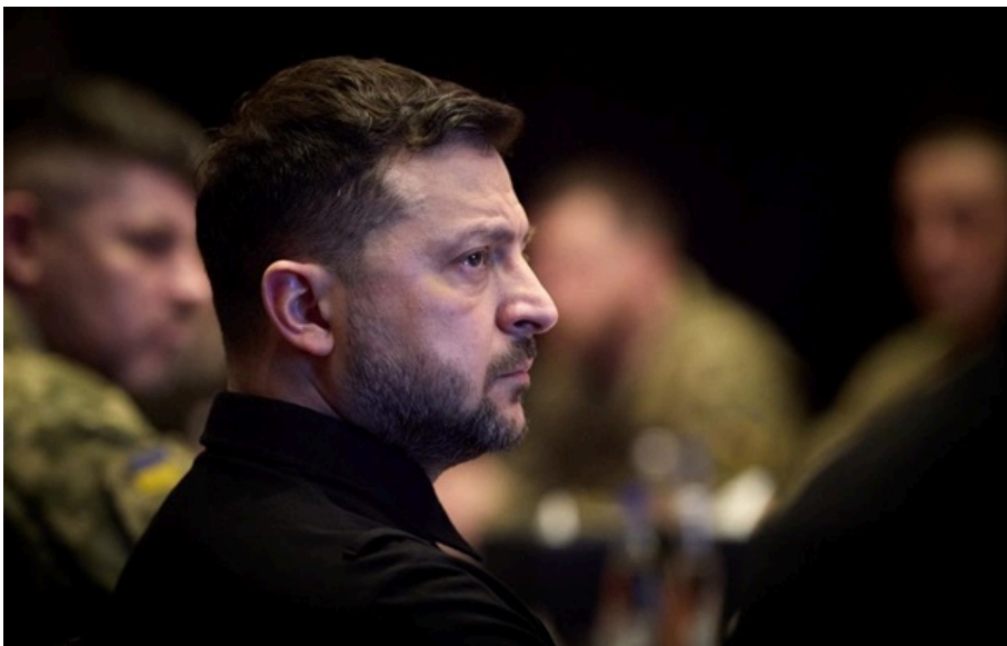
Володимир Зеленський провів засідання Ставки після масованої атаки Росії

Україна відповість на терористичну тактику росіян, які накопичували дрони та ракети протягом певного часу та свідомо вираховували удар таким чином, щоб його масштаб був значним.