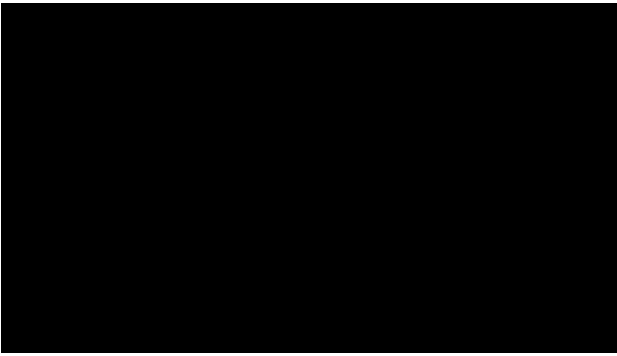
Фото: електронний військовий квиток – юридична сила та термін дії ( mod.gov.ua )

Для більшості школярів е-ВОД є основною формою документа.