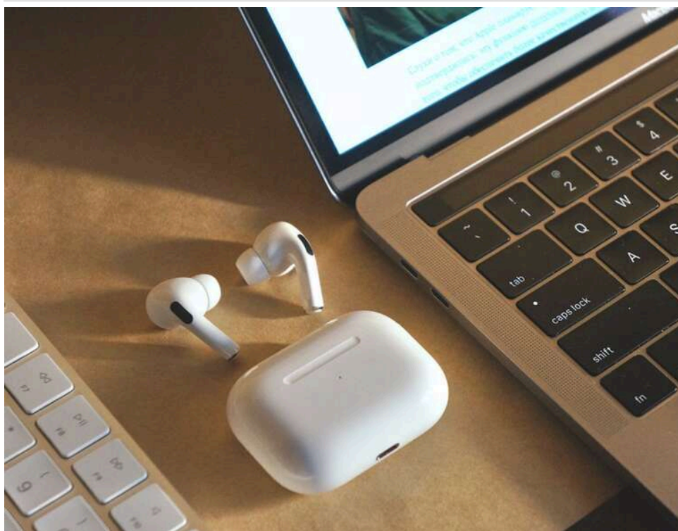
Штраф у 645 тисяч «розсипався» в суді: як ФОП відбився від податківців через їхні помилки під час перевірки

Податківці «провалилися» під час перевірки Apple-магазину: ФОП уникнув штрафу в 645 тисяч гривень.