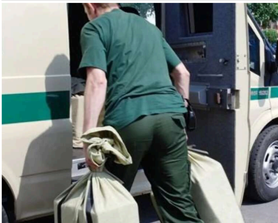
Через дефіцит чоловіків банки масово наймають жінок в інкасацію та сервіс