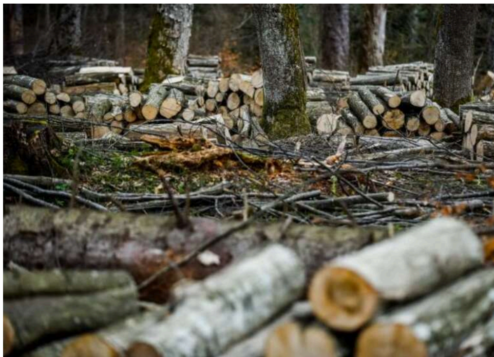
ДБР викрило корупційну схему в ДП «Ліси України»: посадовці щомісяця збирали 300 тисяч гривень «данини»

Працівники Державного бюро розслідувань припинили діяльність корупційної схеми, до якої були причетні посадовці Південного регіонального офісу ДП «Ліси України».