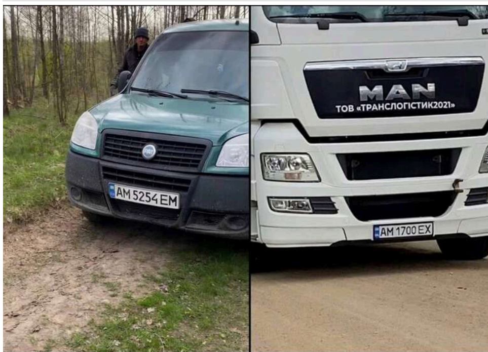
Масштабна вирубка під виглядом оренди паїв: у Хорошівській громаді викрили «чорних лісорубів»

Незаконна вирубка лісу на Житомирщині: мешканці фіксують системну діяльність у Хорошівській громаді.