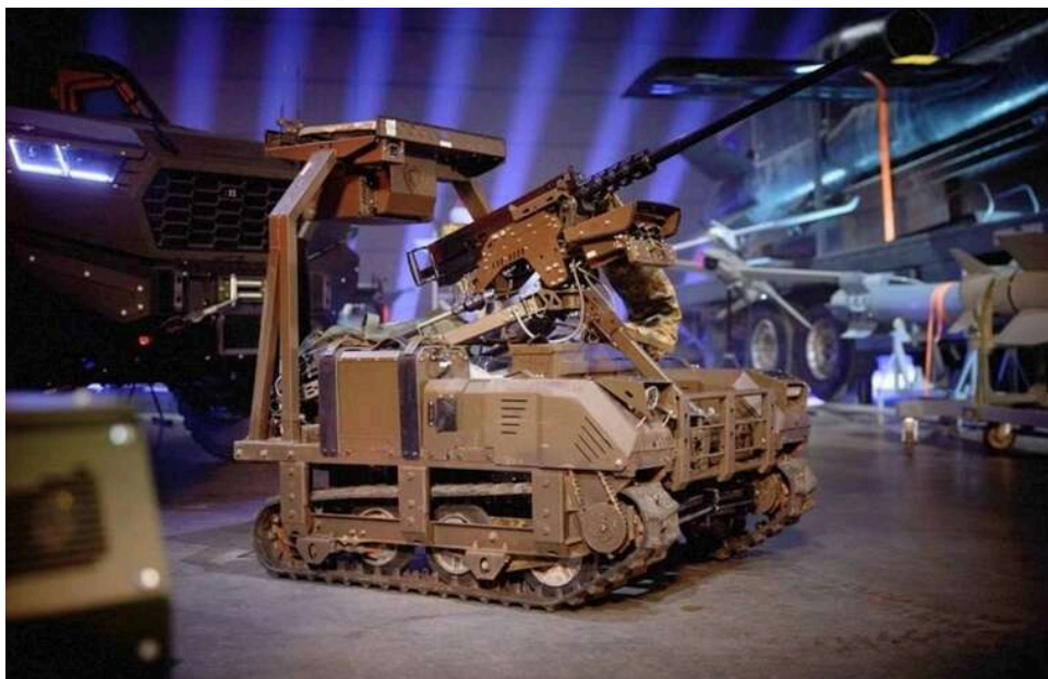
The Independent: Україна переходить до нового етапу війни з активним використанням наземних роботів