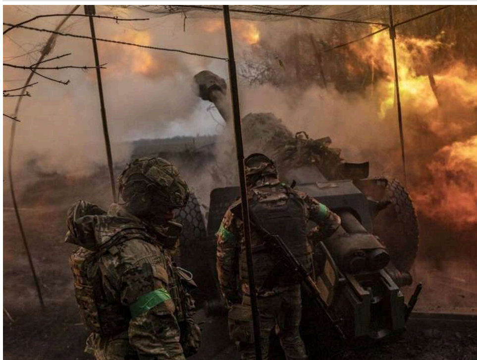
Ситуація на фронті: Зафіксовано 62 боєзіткнення, з них 22 - на Покровському напрямку

Від початку доби агресор 62 рази атакував позиції Сил оборони.