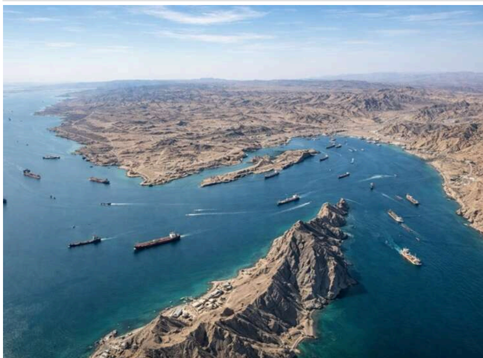
КВІР заявив про захоплення двох суден у районі Ормузької протоки

Корпус вартових ісламської революції Ірану (КВІР) стверджує, що захопив «два судна-порушники» під час ймовірної «таємної спроби вийти» з Ормузької протоки.