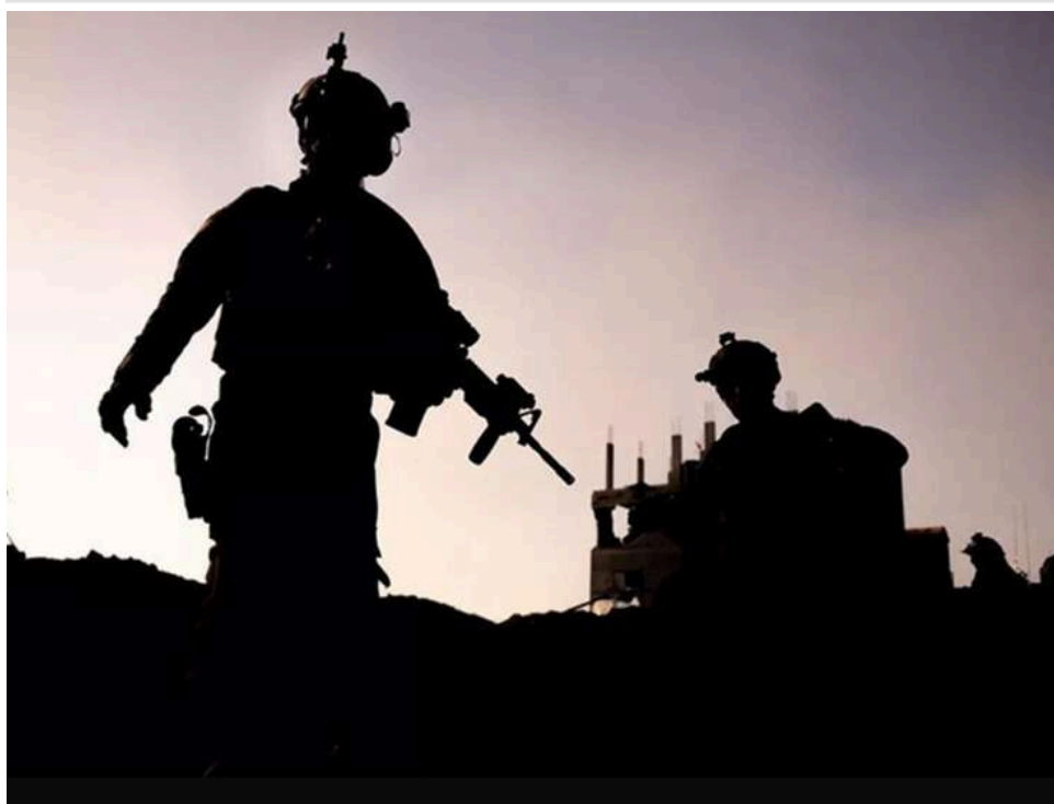
Defense News: США відмовилися від планів перекидання понад 4 тисяч військових до Польщі

Збройні сили США відмовилися від планів розміщення в Польщі понад 4 тисячі військовослужбовців.