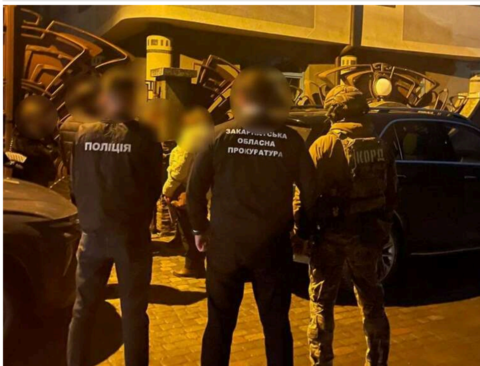
Депутата Ужгородської міськради судитимуть за недекларування активів на понад 13 мільйонів гривень

Депутата Ужгородської міськради судитимуть за приховування активів на понад 13,8 млн грн. Також арештовано його майно та активи дружини: дві квартири в історичній частині Ужгорода, п'ять земельних ділянок, корпоративні права, елітні автомобілі та колекцію з 9 картин, передає Офіс Генпрокурора.