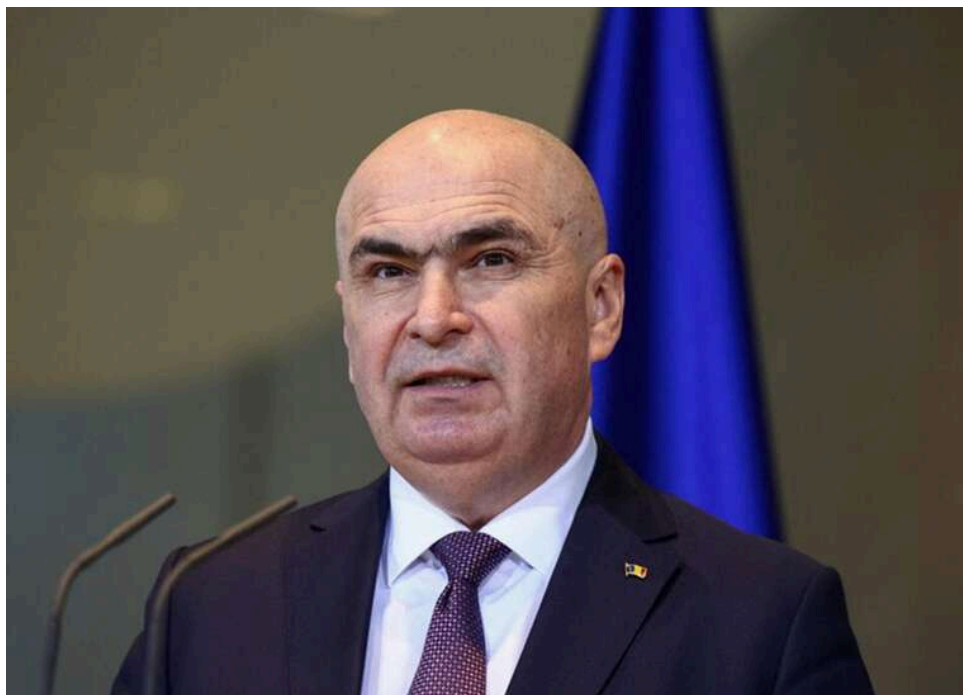
Розпад коаліції в Румунії: прем'єр Боложан відмовився йти у відставку та готує уряд меншості

Прем'єр-міністр Румунії Іліє Боложан заявив про свої плани розпочати переговори з коаліційними партіями для формування уряду меншості після того, найбільша в урядовій коаліції Соціал-демократична партія Румунії (PSD) відклікала свою підтримку його кандидатури.