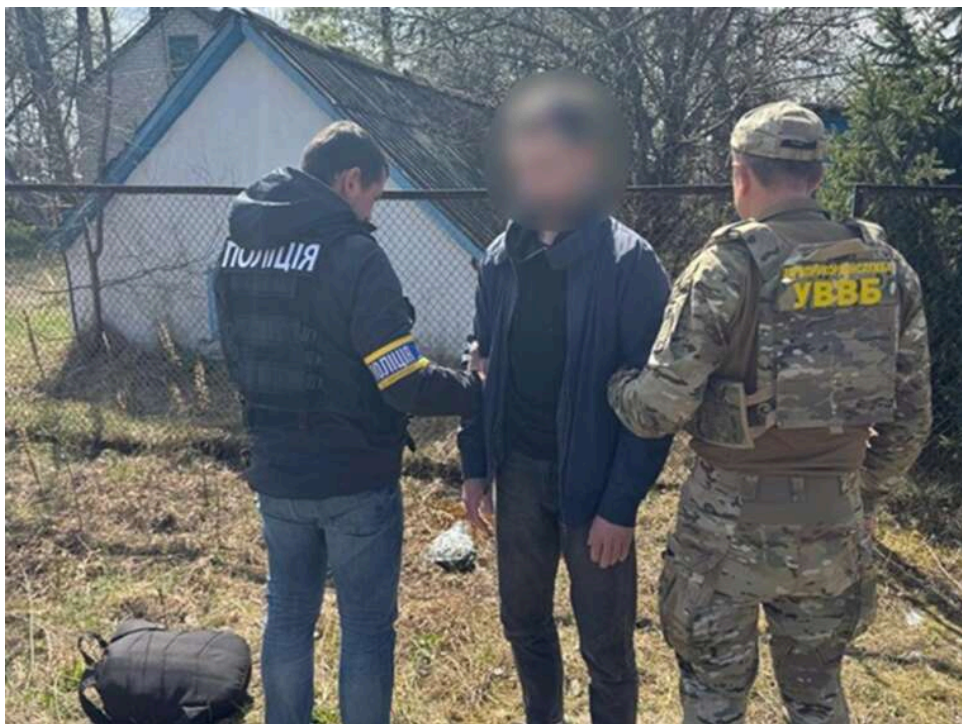
На Волині затримали жителя Рівненщини, який намагався підкупити прикордонника для втечі за кордон

Військовозобов'язаний з Рівненщини пропонував хабар для виїзду за кордон: його затримали на гарячому.