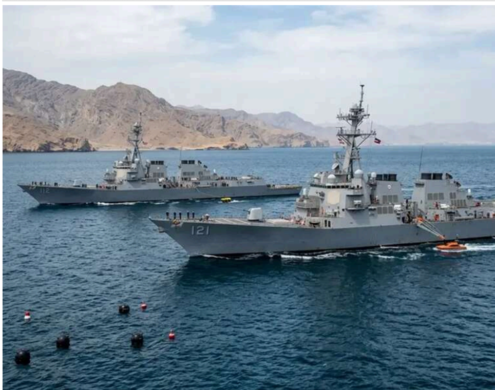
Невловима «флотилія»: чому армія США не може подолати тисячі швидкісних катерів Ірану, – NYT

Американським військам не вдається ліквідувати іранську «флотилію комарів», що блокує Ормузьку протоку, повідомляє The New York Times.