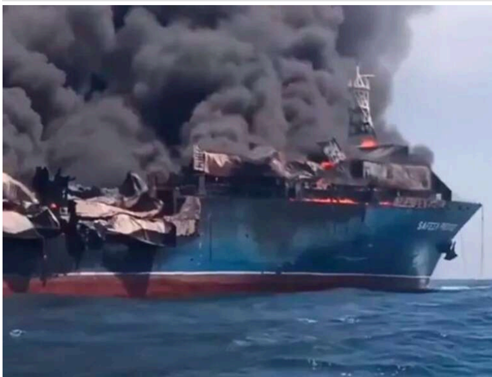
Ультиматум КВІР: Іран погрожує атакувати будь-яке судно в районі Ормузької протоки

Іран оголосив, що будь-яке судно, яке підійде до Ормузької протоки, вважатиметься таким, що діє на боці ворога, й може зазнати атаки.