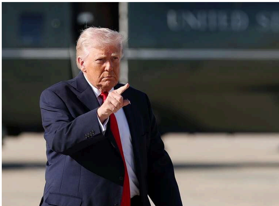
США готові розморозити 20 мільярдів доларів для Ірану в обмін на відмову від збагаченого урану, – Axios

США готові розморозити для Ірану $20 млрд в обмін на відмову від зберігання запасів збагаченого урану.