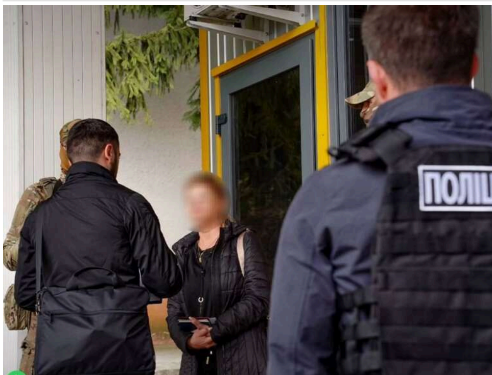
На Закарпатті затримали громадянку Словаччини за вербування українок для сексуальної експлуатації

Масштабний канал переправлення українок за кордон для сексуальної експлуатації ліквідували прикордонники на Закарпатті. Організаторкою схеми виявилася 56-річна громадянка Словаччини, яка вербувала жінок, користуючись їхнім скрутним становищем.