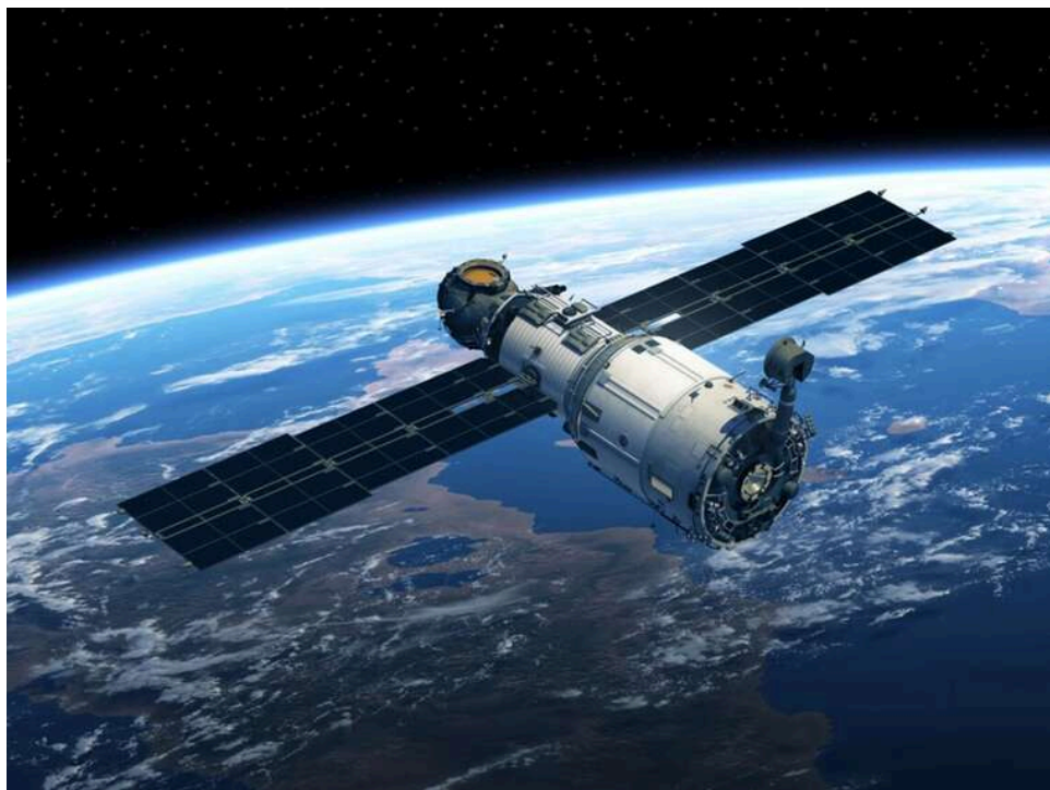
FT: Іран міг використовувати китайський супутник для стеження за базами США