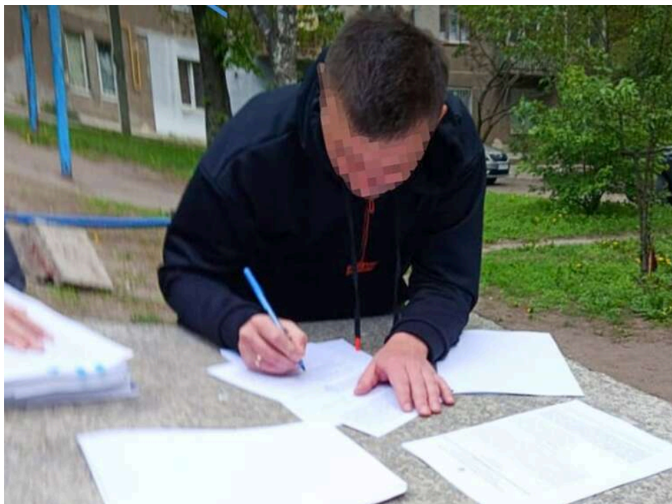
НАБУ викрило експрокурора Дніпропетровщини на вимаганні 80 тисяч доларів хабаря за «пом'якшення» підозри

Колишнього прокурора Слобожанської окружної прокуратури Дніпропетровської області викрили на проханні надати $80 тисяч неправомірної вигоди за підозру за менш тяжкою статтею.