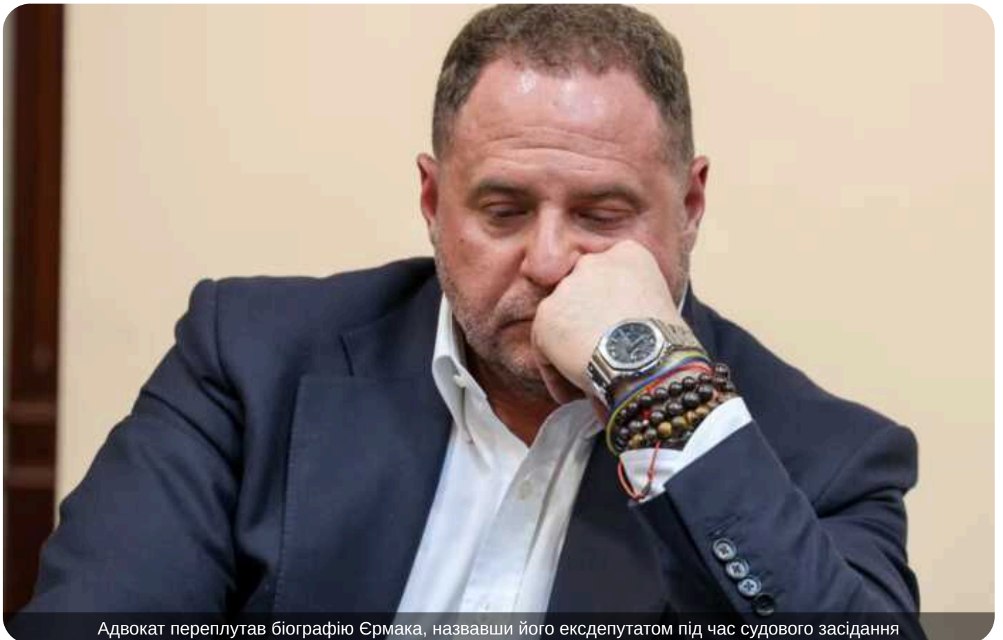
Адвокат переплутав біографію Єрмака, назвавши його ексдепутатом під час судового засідання

Конфуз на судовому засіданні. Адвокат назвав Єрмака колишнім "народним депутатом".