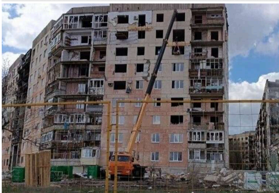
У Сіверськодонецьку зник черговий підрядник: окупанти залишили аварійну багатоповерхівку з "фасадним" ремонтом

У окупованому Сіверськодонецьку зник черговий підрядник, який займався показовим відновленням багатоповерхівки.