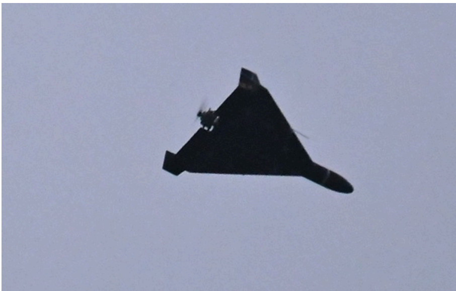
Росіяни атакували Жовкву

У Жовкві стався ворожий приліт в об'єкт критичної інфраструктури. На місці працюють надзвичайні служби.