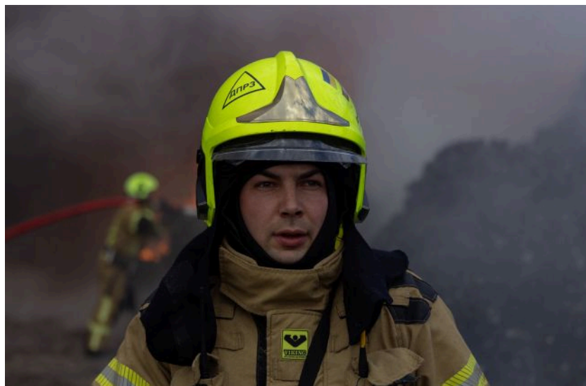
Фото: під ударом 13 травня житлові будинки та енергетика