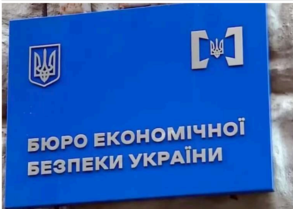
БЕБ розслідує «Оазіс Інтернешнл Груп» за підозрою в ухиленні від податків на понад 10 мільйонів гривень

БЕБ розслідує кримінальну справу щодо ухилення від сплати податків на 10,5 млн компанією одеського ТОВ «Оазіс Інтернешнл Груп».