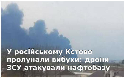
У російському Кстово пролунали вибухи: дрони ЗСУ атакували нафтобазу