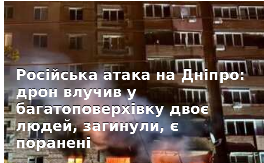
Російська атака на Дніпро: дрон влучив у багатоповерхівку двоє людей, загинули, є поранені