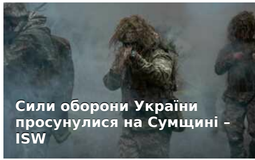
Сили оборони України просунулися на Сумщині - ISW