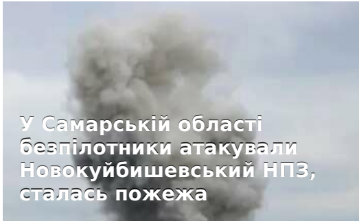
У Самарській області безпілотники атакували Новокуйбишевський НПЗ, сталась пожежа