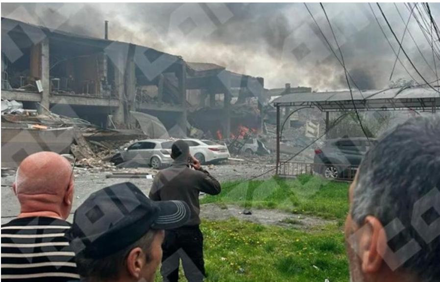
У Владикавказі стався вибух на складі піротехніки

Внаслідок вибуху на складі піротехніки у Владикавказі постраждали вісім осіб, у тому числі дитина.