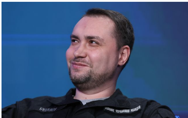
Фото: керівник Офісу президента Кирило Буданов

Удари безпілотників по нафтовій інфраструктурі Росії б'ють не лише по її гаманці - під питання поставлено саму репутацію країни як постачальника сировини.