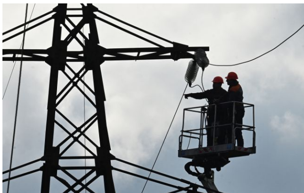
Фото: в "Укренерго" викрили схему розкрадання майже пів мільярда гривень

В Україні викрито масштабну схему розкрадання коштів НЕК "Укренерго", яка діяла у 2022-2024 роках. Збитки державі становлять понад 447 млн гривень.