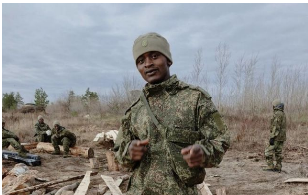
Фото: на Харківщині ліквідували групу кенійців, які воювали на боці Росії (t.me/DIUkraine)

У бою у Харківській області ліквідували ще одну групу громадян Кенії, яких завербувала Росія для війни проти України.