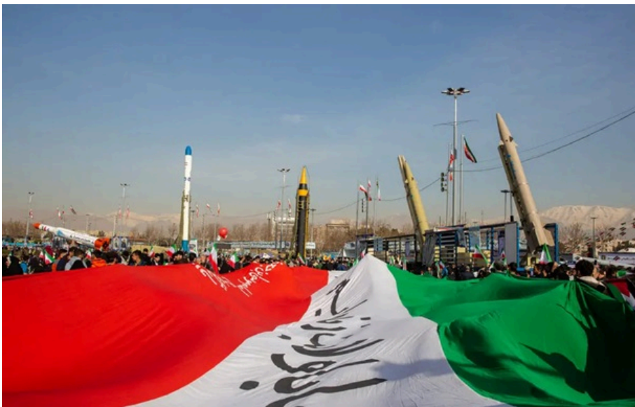
Іран зберіг значну частину свого ракетного потенціалу, вважає розвідка США

Розвідслужби стверджують, що Тегеран зберіг 70% ракетного потенціалу, попри заяви президента США про знищення іранської військової машини.