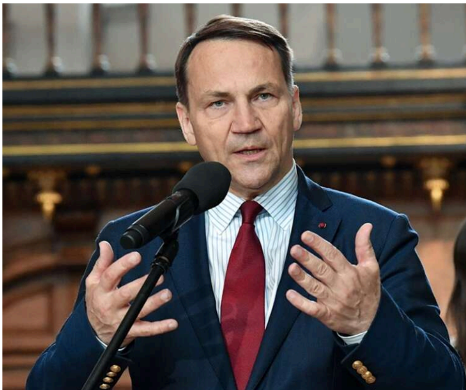
«Чи зможе він воювати ще два роки?»: Сікорський заявив про зміну розрахунків Путіна через стабілізацію фронту

Міністр закордонних справ Польщі Радослав Сікорський припускає, що очільник Кремля починає серйозно замислюватися над тим, скільки ще зможе вести свою загарбницьку війну проти України і чи є в цьому сенс.