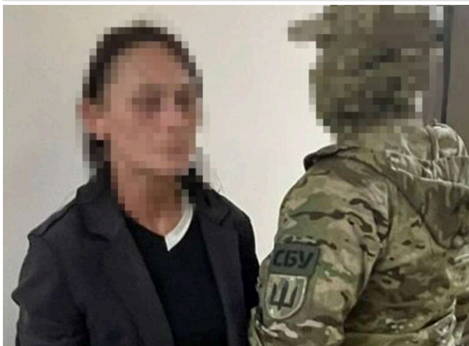
СБУ в Одесі затримала агентку ФСБ, яка готувала замах на офіцера ССО